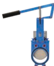
HERA ® -BD avec poignée