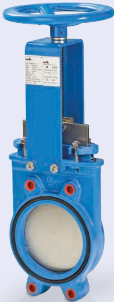
HERA ® -BD avec volant