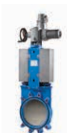
HERA ® -BD avec actionneur électrique