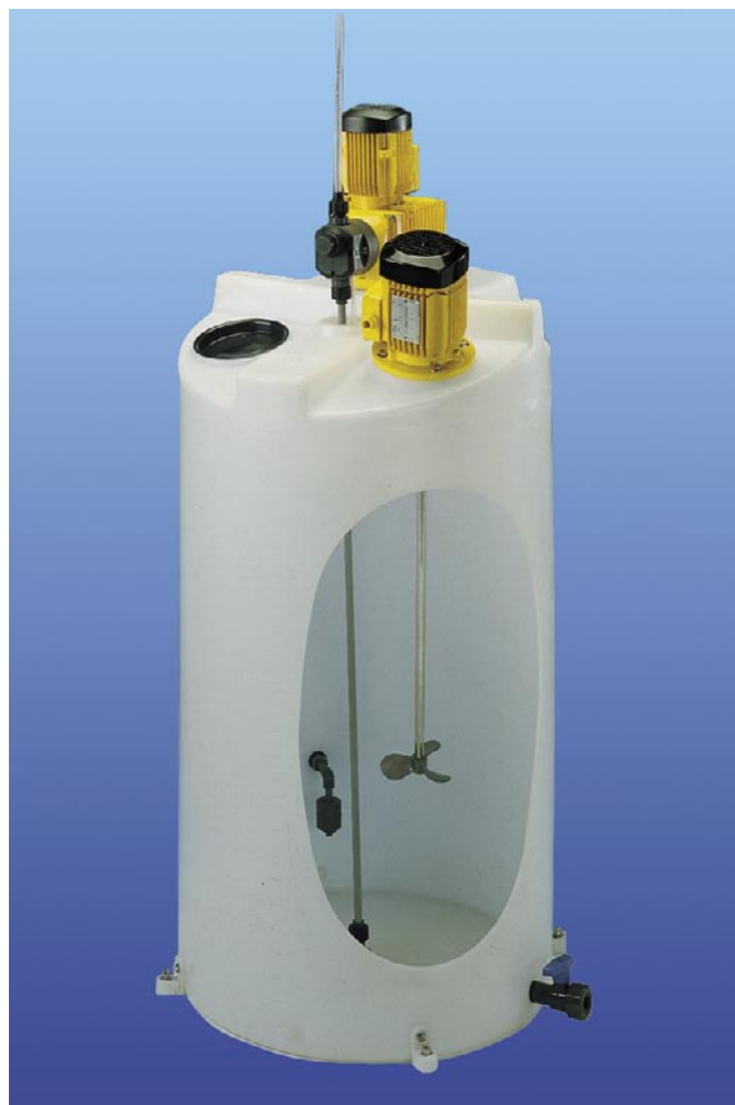
Station DOSAPACK® 250 l