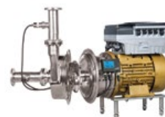
Vitachrom® PumpDrive avec KSB SuPremE® et PumpMeter