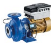
Etabloc PumpDrive avec KSB SuPremE® et PumpMeter