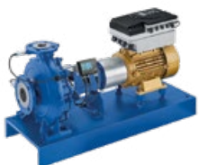
Etanorm PumpDrive avec KSB SuPremE® et PumpMeter