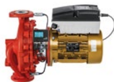
Etaline PumpDrive avec KSB SuPremE® et PumpMeter